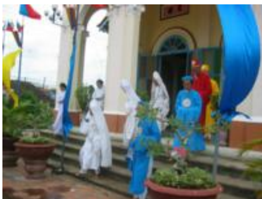
Rouge, couleur du confucianisme, bleu, du taoïsme, et jaune, du bouddhisme

Dans le caodaïsme, l' enseignement de Khong Phu Tseu (morale de vie en société en harmonie avec ce que préconise le Ciel) et la partie de celui du bouddhisme qui mène vers la cessation de la souffrance (giải khổ) constituent son côté exotérique . C'est aussi la fondation, la base des branches de la partie " Phổ Độ " (qui peut se traduire par "destiner tous les êtres au salut"), celle dont l'action est orientée vers la propagation de la religion. Ces branches possèdent une organisation hiérarchique digne de l'église catholique. L' enseignement de Lao Tseu (sérénité avec et pour soi-même à travers le Vô Vi (wu-wei 無為 en chinois, le Non-Agir) et résolution de la dualité Yin et Yang, qui accompagne la création, en revenant vers l'Un) et la partie de celui du bouddhisme qui vise la délivrance totale (giải thoát) correspondent à la partie ésotérique .