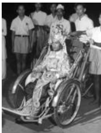
Đức Hộ Pháp Phạm Công Tắc dans son "cyclo papal" – juillet 1948