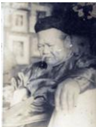
Đức Giáo Tông Nguyễn Ngọc Tương

La cérémonie d'achèvement de l'œuvre de Chỉnh Đạo (Rectification de la Religion) eut lieu du 7 au 15 Janvier 1938 (du 08 au 15 du 1 er mois de l'année Mậu Dần (du Tigre) 1938). L'Église caodaïste Ban Chỉnh Đạo (du Comité de Rectification de la Religion) se renomma " Hội Thánh Tam Kỳ Phổ Độ " (Église de la Grande Voie de la Troisième Amnistie), mais, dans la pratique, sur les enseignes des temples et les papiers administratifs, on peut encore voir la mention " Hội Thánh dưới quyền ủng hộ của Đức 9 Giáo Tông Nguyễn Ngọc Tương " (Église ayant le soutien du Đức Giáo Tông Nguyễn Ngọc Tương ).