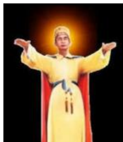
Đức Hộ Pháp Phạm Công Tắc donnant sa bénédiction

Les généraux caodaïstes de Tây Ninh négocieront avec les Français un accord signé le 9 juin 1946 permettant le retour le 21 août 1946 du Hộ Pháp Phạm Công Tắc, de Madagascar, où il avait été exilé depuis 1941, en échange de l'engagement de lutter contre le Việt Minh qui avait massacré plusieurs milliers de caodaïstes, en particulier à Quảng Ngãi au Centre Việt Nam.